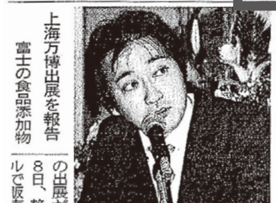
上海万博出展を報告 富士の食品添加物

第1四半期連結決算 北米利益は大幅増。浜松ホトニクスは8日、2009年10~12月の第1四半期連結決算を発表した。売上高が194億9100万円(前年800万円(同10.2%増)、伸びが目立った。減益は2年連続。事業別売上高は光電子0万円(同5.6%減)